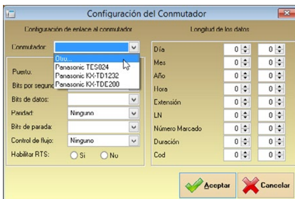
Configuración del Conmutador