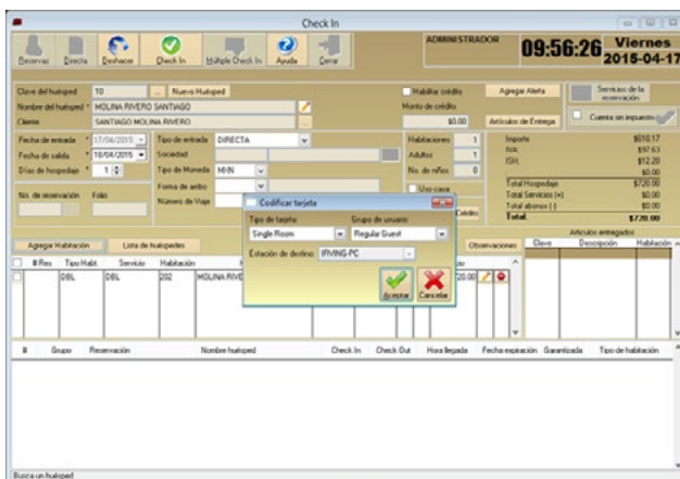
Codificación de tarjeta al hacer Check In